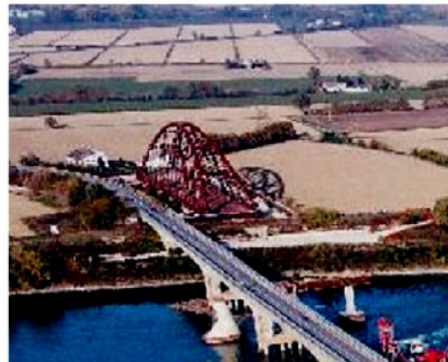
L'arcata del lato bagnolese che sarà varata nelle prossime settimane